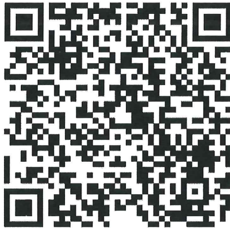
網路報名 QR code

請參加人員透過 Google 表單進行報名，以利報名作業資料彙整，謝謝 若報名流程有任何問題請透過電話或 email 聯繫 (03)573-0675 分機 24 曹書涵 小姐 E-mail： shuhan@edf.org.tw